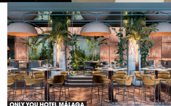
ONLY YOU HOTEL MÁLAGA

HOTEL ICON MALABAR El premiado Alfonso Merry del Val y el equipo de Merry Design Studio firman el estupendo proyecto que se inspira en el estilo colonial de la Málaga industrial del XIX. iconmalabar.com