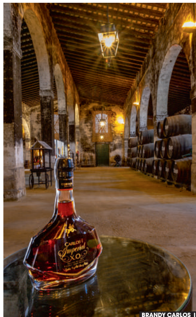
BRANDY CARLOS I

Nace en 1879 con el propósito de alcanzar la excelencia, que ya por entonces tenían productos como el champagne o el caviar Beluga. Los ibéricos cuentan con un espacio de hasta más de dos hectáreas por animal, donde se alimentan con varios tipos de bellotas, hierbas, setas... el clima serrano, el trabajo artesano y el tiempo de curación en sus bodegas (en las fotos, exterior e interior) hacen el resto. Están en Jabugo y en ellas se realizan visitas guiadas y catas. cincojotas.es